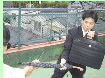
ナイフに対してカバンとカサで防御