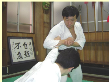
肩をつかまれてもそのまま手首を痛める