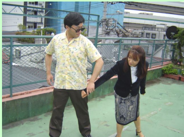
連れて行かれそうになった場合の対処例

また 2006 年 7 月開始の新クラスですので、途中から入っても経験者ばかりでついていけないのでは？といった心配もご無用です。