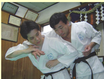
背後からの抱きつきにまず肘打ち

今回新設する土曜クラスでは、すでに他人事ではなくなりつつある身のまわりの危険に対し、現代人が身につけておくべきセルフディフェンステクニックもあわせて指導いたします。